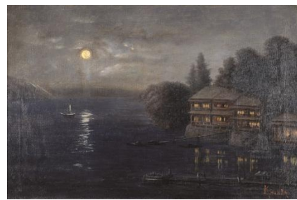
(3)本多錦吉郎《中禅寺湖夜景》1880年頃 油彩、カンヴァス 当館所蔵