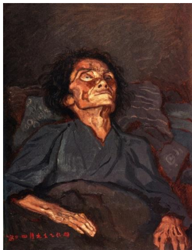
(4)五姓田義松《老母図》1875年 油彩、カンヴァス 神奈川県立歴史博物館所蔵

※申込不要、参加無料(ただし「原田直次郎展」または「コレクション展1」の当日観覧券が必要です)