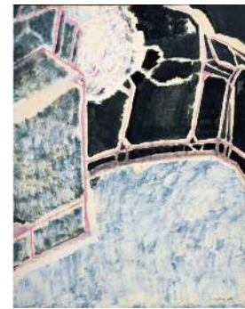
7. 坂倉新平《内なる光—リラ色（1）》 油彩、カンヴァス 1992年