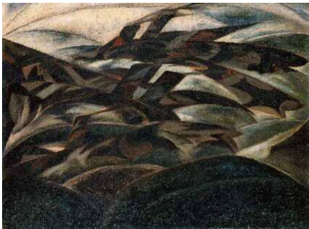
2. 久米民十郎《Off England》 油彩、カンヴァス 1918年

神奈川県立近代美術館 広報担当メールアドレス info.kinbi.474@pref.kanagawa.jp