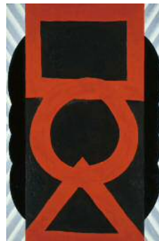
6. 菅井汲《赤と黒》 油彩、カンヴァス 1964年