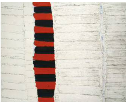
5. 堂本尚郎《連続の溶解5》 油彩、カンヴァス 1964年