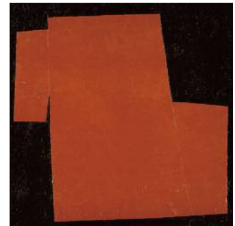
4. 山口長男《平面》 油彩、板 1958年