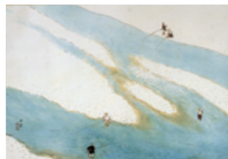
《夏川》 1953(昭和28)年 紙本・着色 軸装 個人蔵