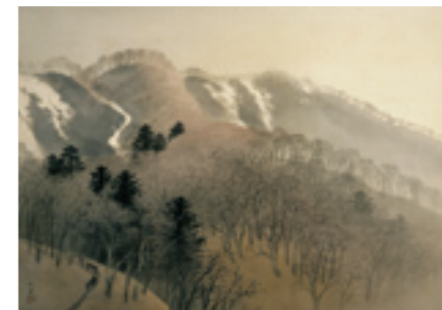
《峰の夕》 1935(昭和10)年 絹本・着色 軸装 個人蔵 *後期(11/8~23)のみ展示