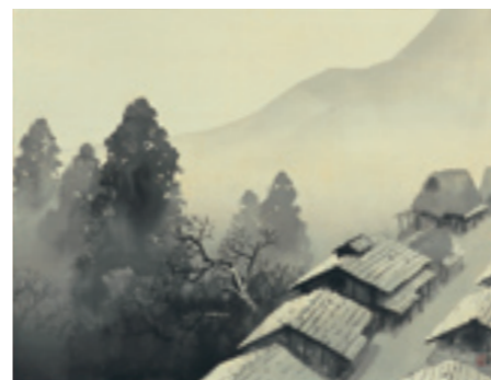
《月天心》 1954(昭和29)年 絹本・墨画 軸装 公益財団法人岡田文化財団 パラミタミュージアム