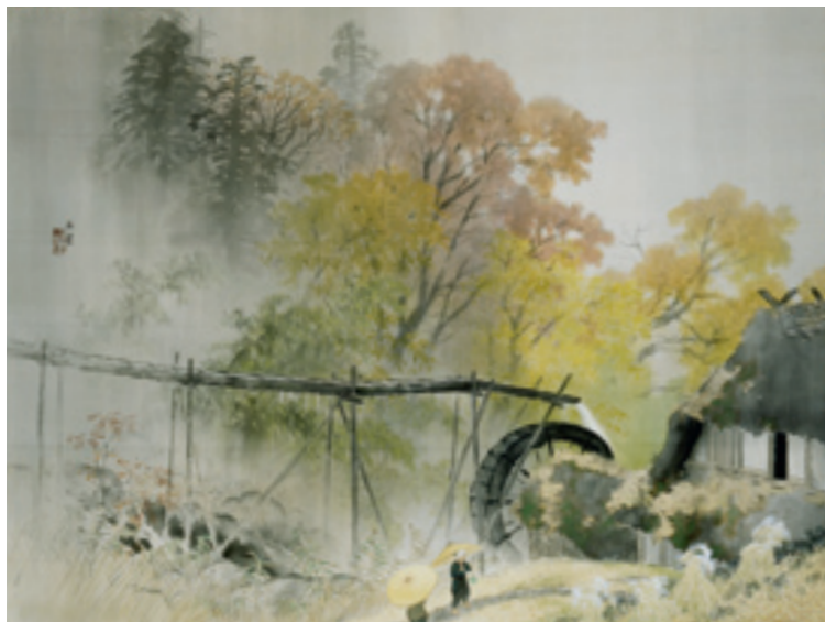
《彩雨》 1940(昭和15)年 絹本・着色 軸装 東京国立近代美術館