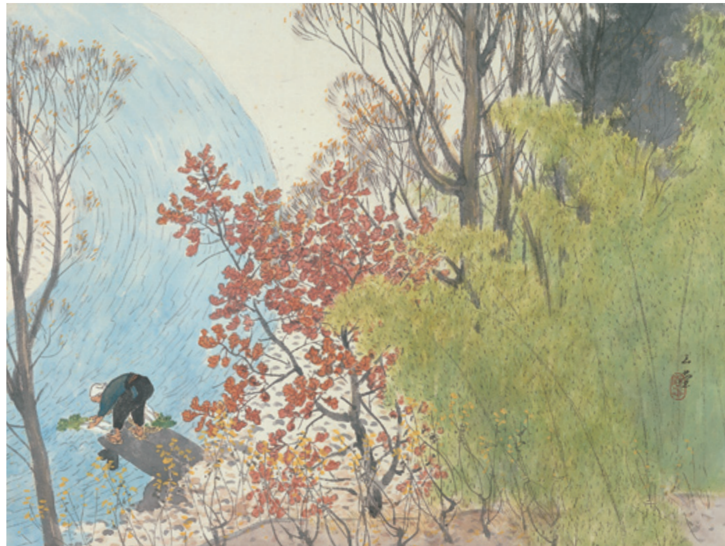
《秋晴》 1955(昭和30)年頃 紙本・着色 軸装 西宮市大谷記念美術館