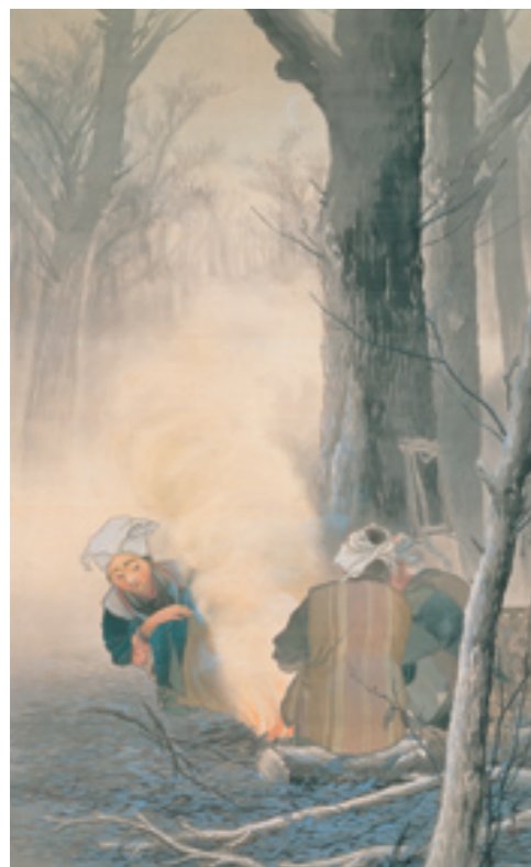
《焚火》 1903(明治36)年 絹本・着色 軸装 五島美術館 *後期(11/8~23)のみ展示

本展は、玉堂の生涯を《「山水画」の時代》《「風景画」の時代》《「情景画」の時代》の三期に分け、代表的な作品によって紹介します。近代日本画の大家である玉堂の仕事振り返り、この画家が今の時代に残した風景像を探訪する大規模な回顧展です。現在ではその多くが失われ、忘れ去られていった「日本の原風景」を、画家がどうとらえ、どのように表現したのかを再確認しつつ、玉堂芸術の精華をご堪能いただければ幸いです。