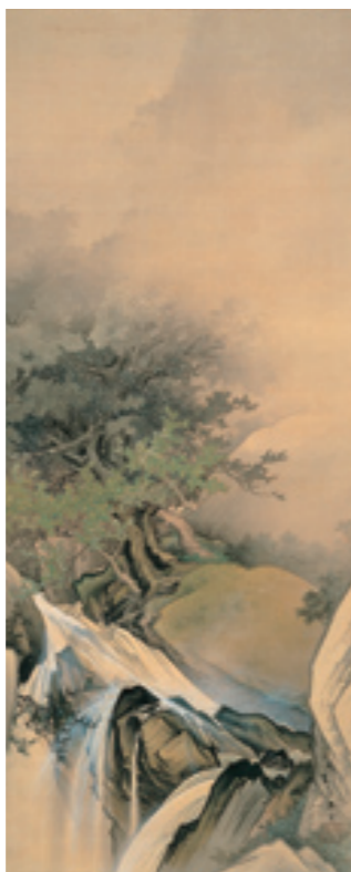
《奔瀑遊猿》 1897(明治30)年 絹本・着色 軸装 一宮市博物館