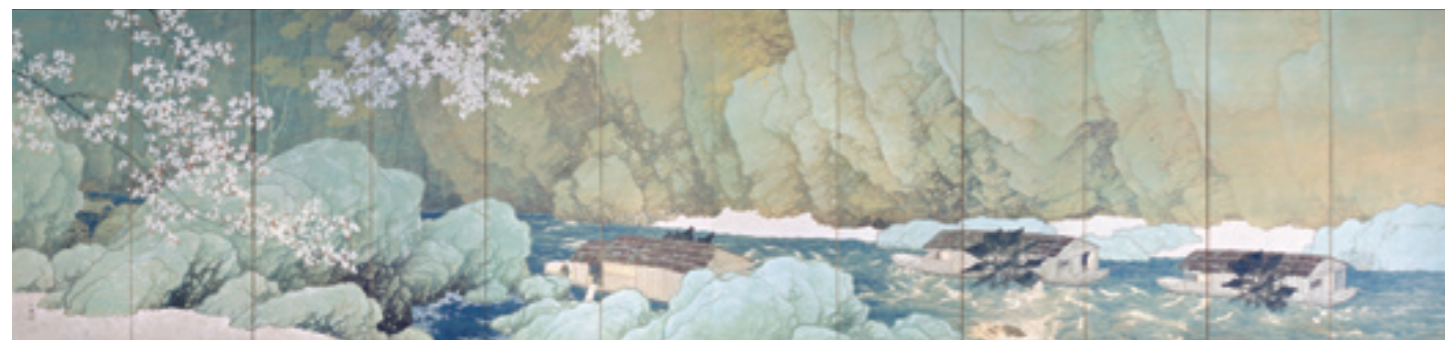
《行く春》(重要文化財) 1916(大正5)年 紙本・着色 六曲一双屏風 東京国立近代美術館