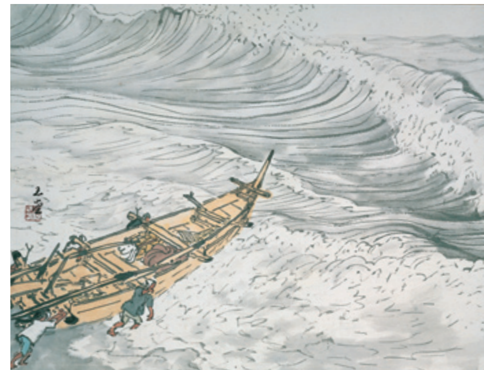
《出船》(絶筆) 1957(昭和32)年 紙本・着色 軸装 個人蔵