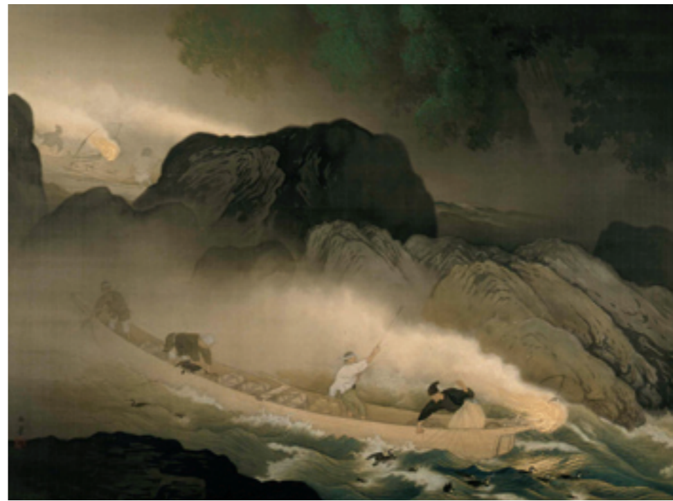
《鶴飼》 1931(昭和6)年 絹本・着色 額装 東京藝術大学

明治後期、それまでの固定化された名所や、パターン化された風景ではなく、身近な名もない風景の中にも美を見出す、自然への視覚や意識の変化が文学作品をはじめとする各ジャンルで明らかになってきます。絵画の分野において、それは「山水画」から「風景画」への転換の時期でした。こうした中で玉堂も近代的「風景画」の確立を目指していました。それが結実したのが1907(明治40)年の《二日月》です。ここでは、現実的な光・空間・色彩などの表現を獲得し、日本の風景画に新しい局面を切り開いた時期を辿ります。