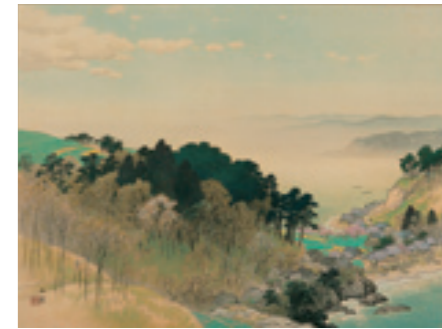
《鶴之春》 1937(昭和12)年 絹本・着色 軸装 桑山美術館