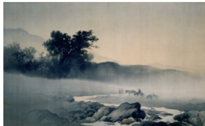
《二日月》 1907(明治40)年 絹本・着色 軸装 東京国立近代美術館