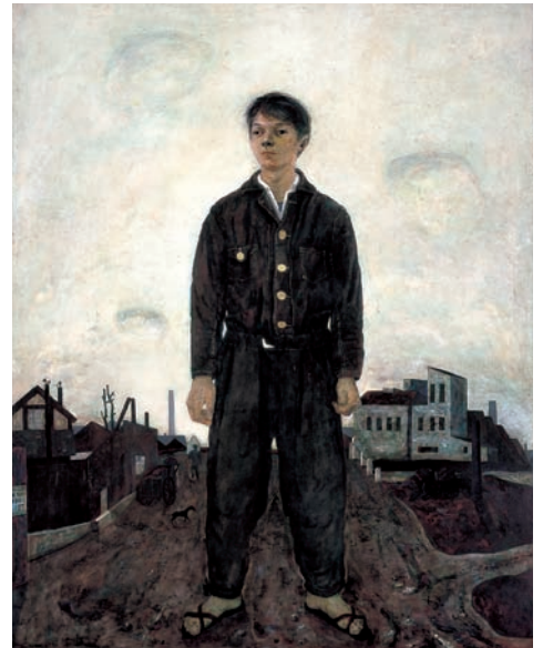
松本竣介 《立てる像》 1942年 油彩、カンヴァス