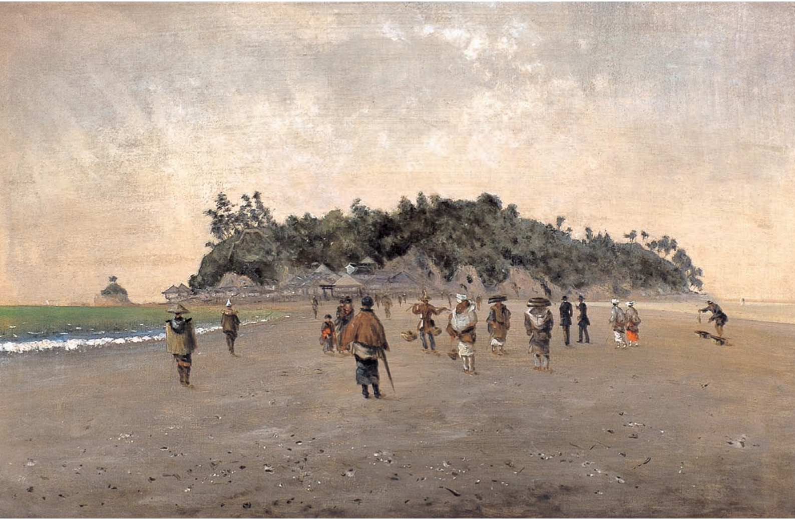
高橋由一 《江の島図》 1876-77年 油彩、カンヴァス