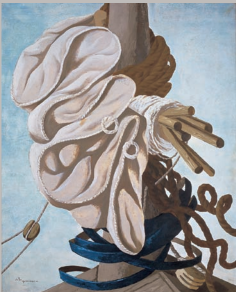
吉原治良 《帆柱》 1931年 油彩、カンヴァス