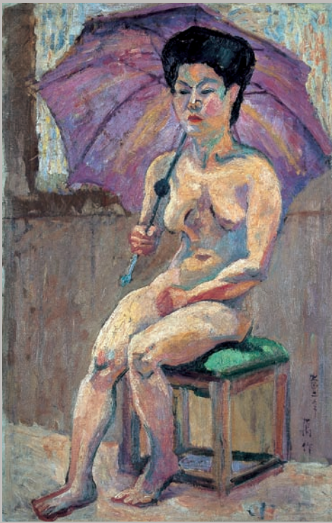
萬鉄五郎 《日傘の裸婦》 1913年 油彩、カンヴァス

今回の展覧会では、所蔵作品の代表作約80点を前期・後期に分けて展覧します。80年に及ぶ日本近代洋画のダイナミックな流れをご堪能下さい。