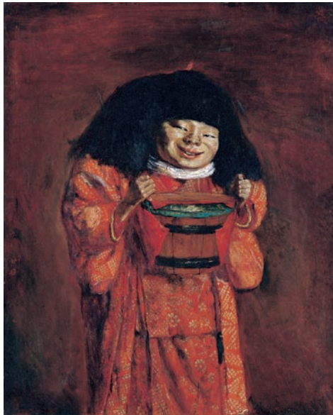
岸田劉生 《野童女》(寄託) 1922年 油彩、カンヴァス