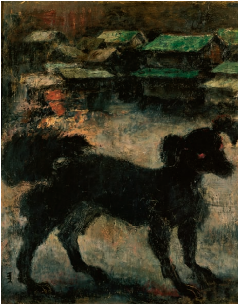
須田国太郎 犬 1950年 東京国立近代美術館蔵

SUDA Kunitaro: Looking Back 50 Years After His Death