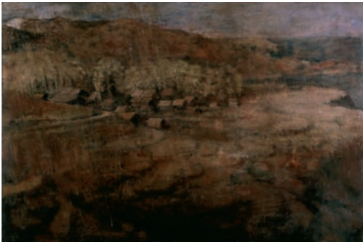
《筆石村》1938年 静岡県立美術館