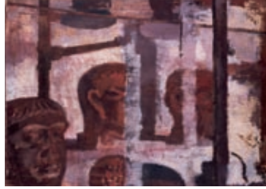
《グレコ・イベリアの首》1931年 京都国立近代美術館