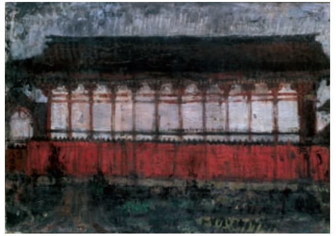
《窪八幡》1955年 東京国立近代美術館