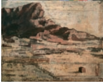
《ハッカ》1922年 公益財団法人上原近代美術館