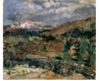
《雪の比叡山》1940年 神奈川県立近代美術館