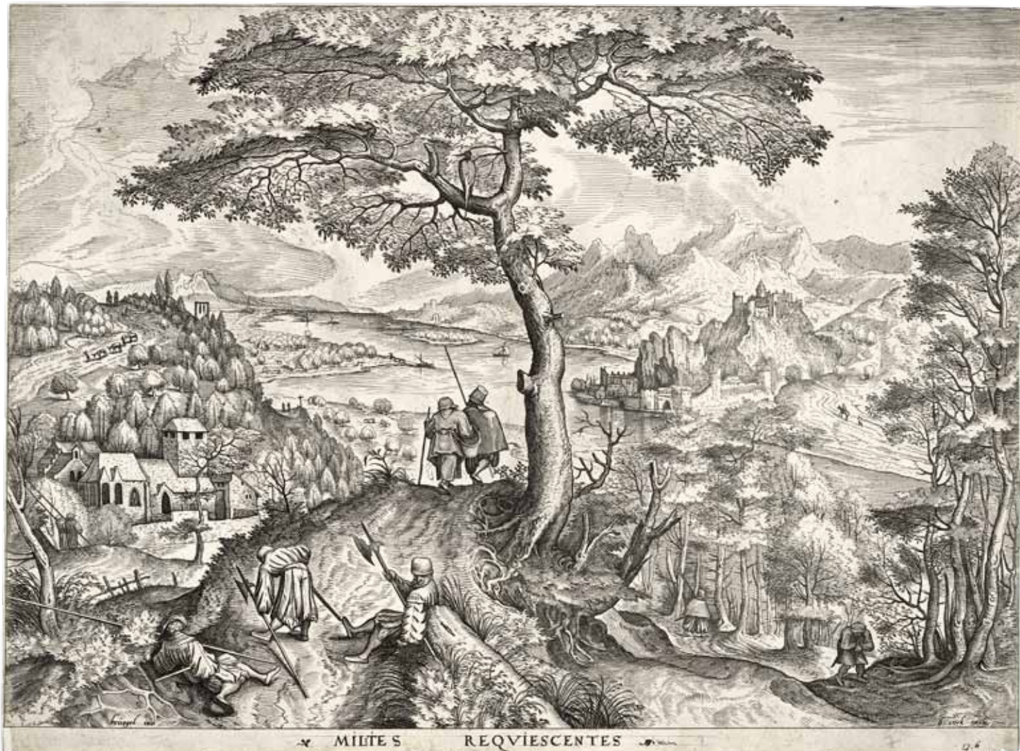
ピーテル・ブリューゲル《休息する兵士たち》(『大風景画』より) 1555-56年頃 神奈川県立近代美術館蔵