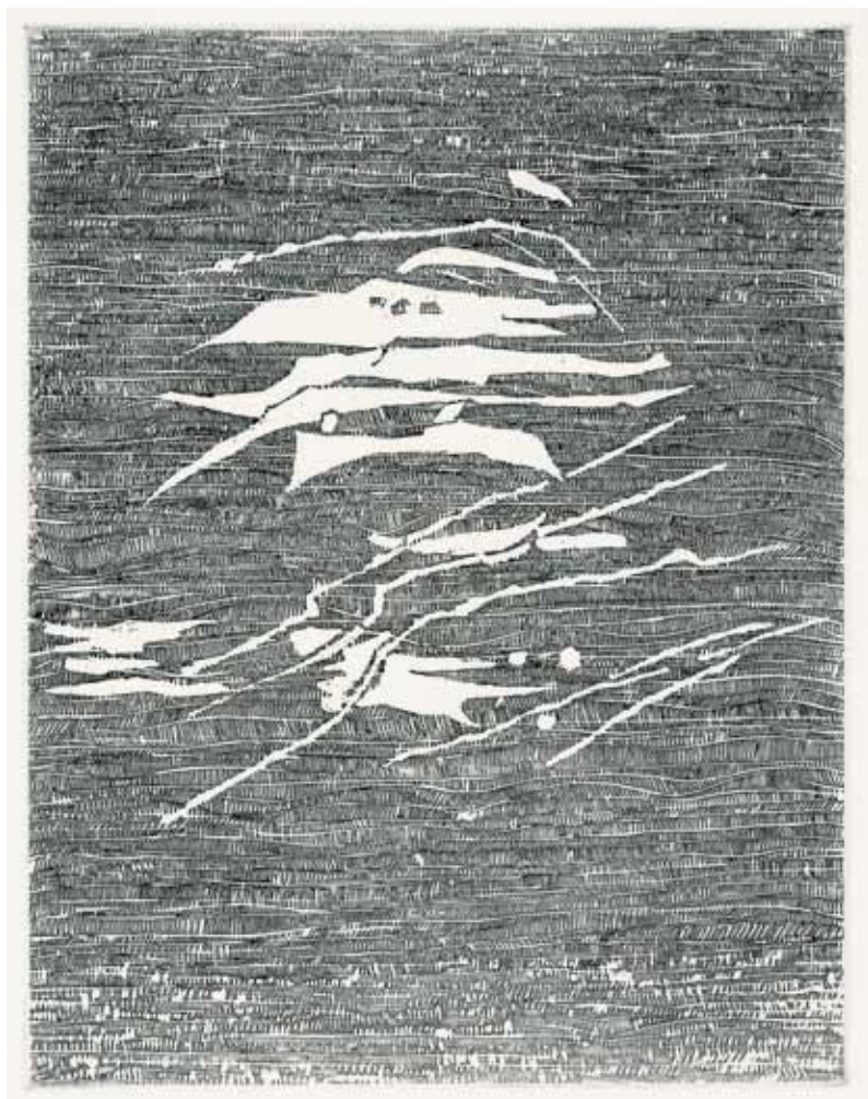
ジゼル・ツェラン=レトランジュ 詩画集『息の結晶』より 1963-64年 個人蔵 ©ericcelan, 2013

神奈川県立近代美術館 鎌倉別館 The Museum of Modern Art, Kamakura Annex