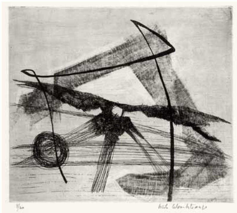
ジゼル・ツェラン=レトランジュ《時のイメージ》1956年 個人蔵 ©ericcelan, 2013

この展覧会では、16世紀のフランドルで活躍したブリューゲル、17世紀フランスで活躍したカロ、18世紀イタリアのティエポロ、19世紀にかけてはスペインのゴヤ、イギリスのブレイク、ドイツのクリンガー、そして20世紀のルオー、シャガール、ピカソまで、当館のコレクションから西洋版画の流れをたどります。