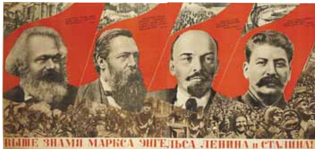
グスタフ・クルーツィス《マルクス、エンゲルス、レーニン、スターリンの旗をより高く!》1933年、リトグラフ・紙 Ruki Matsumoto Collection Board