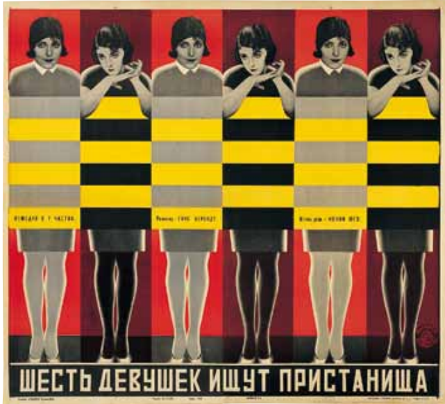
ウラジーミル&ゲオルギー・ステンベルク《6人の娘が隠れ家を探す》1928年、リトグラフ・紙 Ruki Matsumoto Collection Board © Stenberg/RAO, Moscow/JASPAR, Tokyo, 2013 C0056