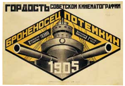
アレクサンドル・ロトチェンコ《戦艦ポチョムキン》1925/26年、リトグラフ・紙 Ruki Matsumoto Collection Board