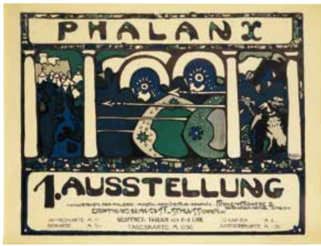
ワシーリー・カンディンスキー《ファランクス第1回展覧会》1901年、リトグラフ・紙 Ruki Matsumoto Collection Board