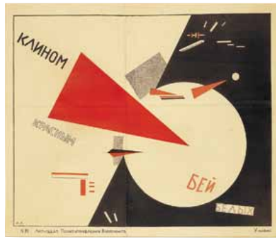
エリ・リシツキー《赤い旗で白を打て》1920年、リトグラフ・紙 Ruki Matsumoto Collection Board