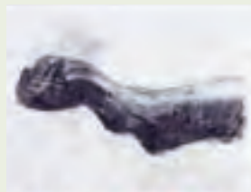
宮崎進《習作「ヒロシマ」手》 2005年、コンテ・紙、個人蔵