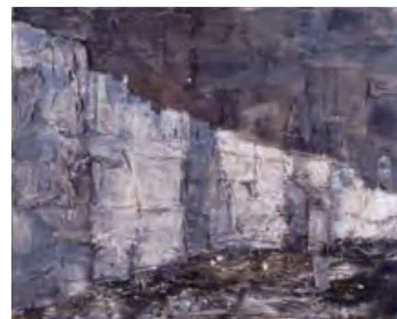
宮崎進《ラーゲリの壁(コムノリスク第3分所)》1988年 ミクストメディア・麻布・合板、高知県立美術館蔵