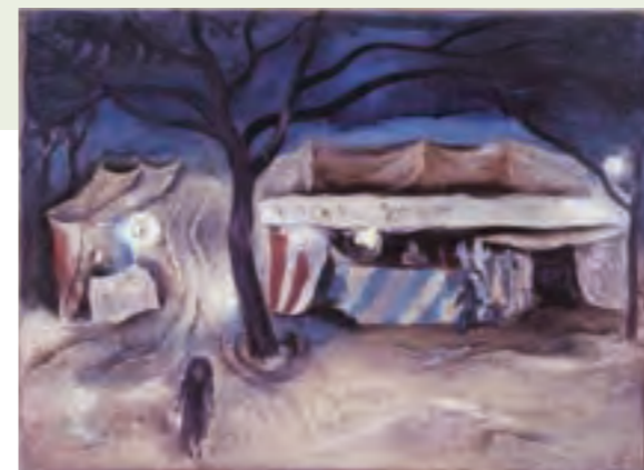
宮崎進《冬》1968年、油絵具・カンヴァス、個人蔵