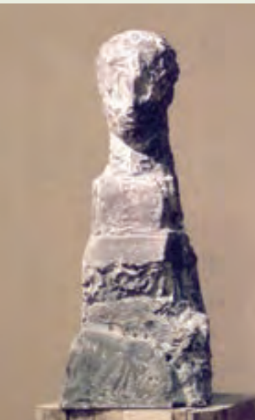
宮崎進《ナナエツの少女》 1996年、石膏・着彩 新潟県立近代美術館・万代島美術館蔵