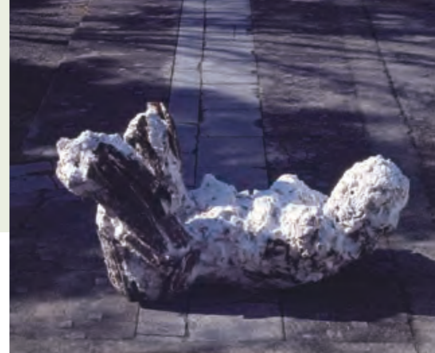
宮崎進《横たわる》2001年、麻布・ミクストメディア・石膏・木、作家蔵