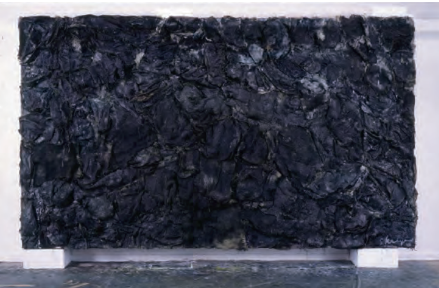
宮崎進《泥土》2004年、ミクストメディア・麻布・合板、当館蔵