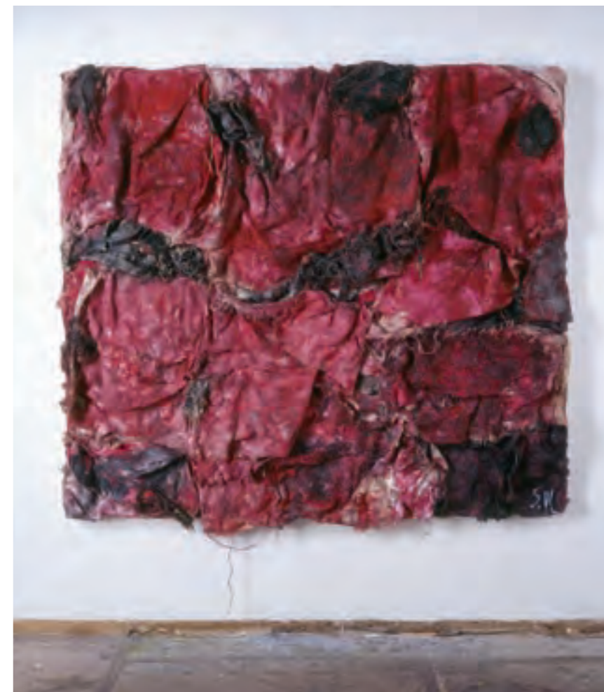
宮崎進《花咲く大地》2004年、ミクストメディア・麻布・合板、当館蔵