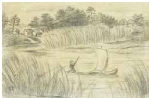
左上から 黒田清輝《逗子五景》[部分] 1898年頃 油彩、板/片岡球子《面構 等持院殿》1967年 着彩、カンヴァス/萬鉄五郎《茅ヶ崎・柳島》1924年頃 鉛筆、紙/青山義雄《茅ヶ崎風景》1965年 油彩、カンヴァス すべて当館蔵