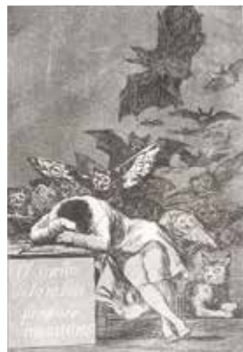
フランシスコ・デ・ゴヤ《「ロス・カプリチオス(気まぐれ)」43 理性の眠りは怪物を生む》1797-98年/1799年初版 エッチング、アquarell、紙 当館蔵

ゴヤからクリンガーまで The Genealogy of Fantasy: From Goya to Klinger