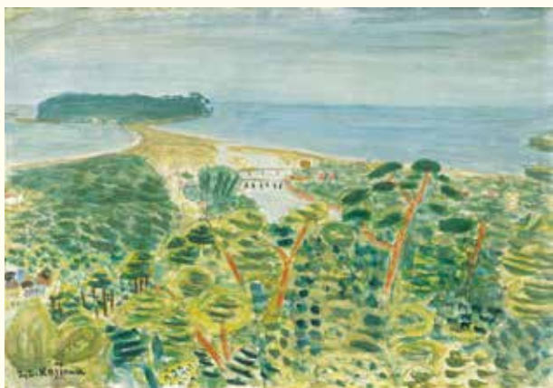
左上から [すべて当館蔵] 朝井閑右衛門《祭—お狐》1977年 油彩、カンヴァス 岸田劉生《初夏の麦畑と石垣》1920年 油彩、カンヴァス 児島善三郎《江之島風景》1936年頃 油彩、カンヴァス