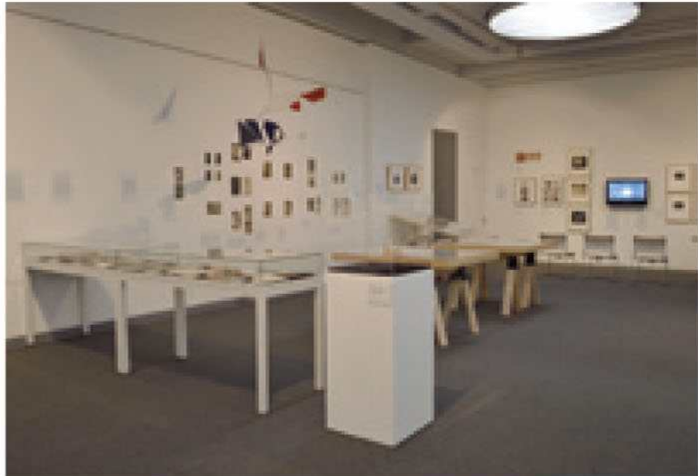
「実験工房展 戦後芸術を切り拓く」会場 2013年