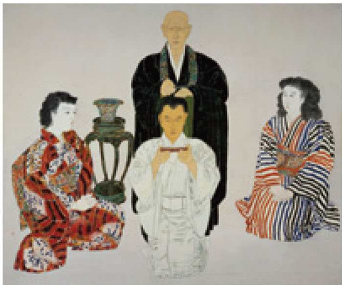
片岡球子《剃髪》1950年、紙本着彩、当館蔵