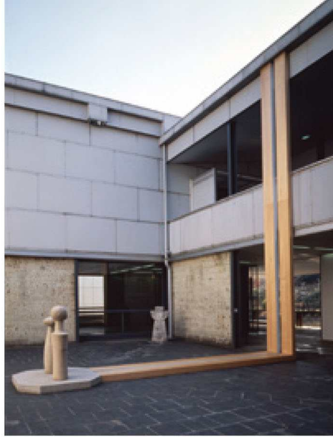
「ダニ・カラヴァン展」会場 1994年