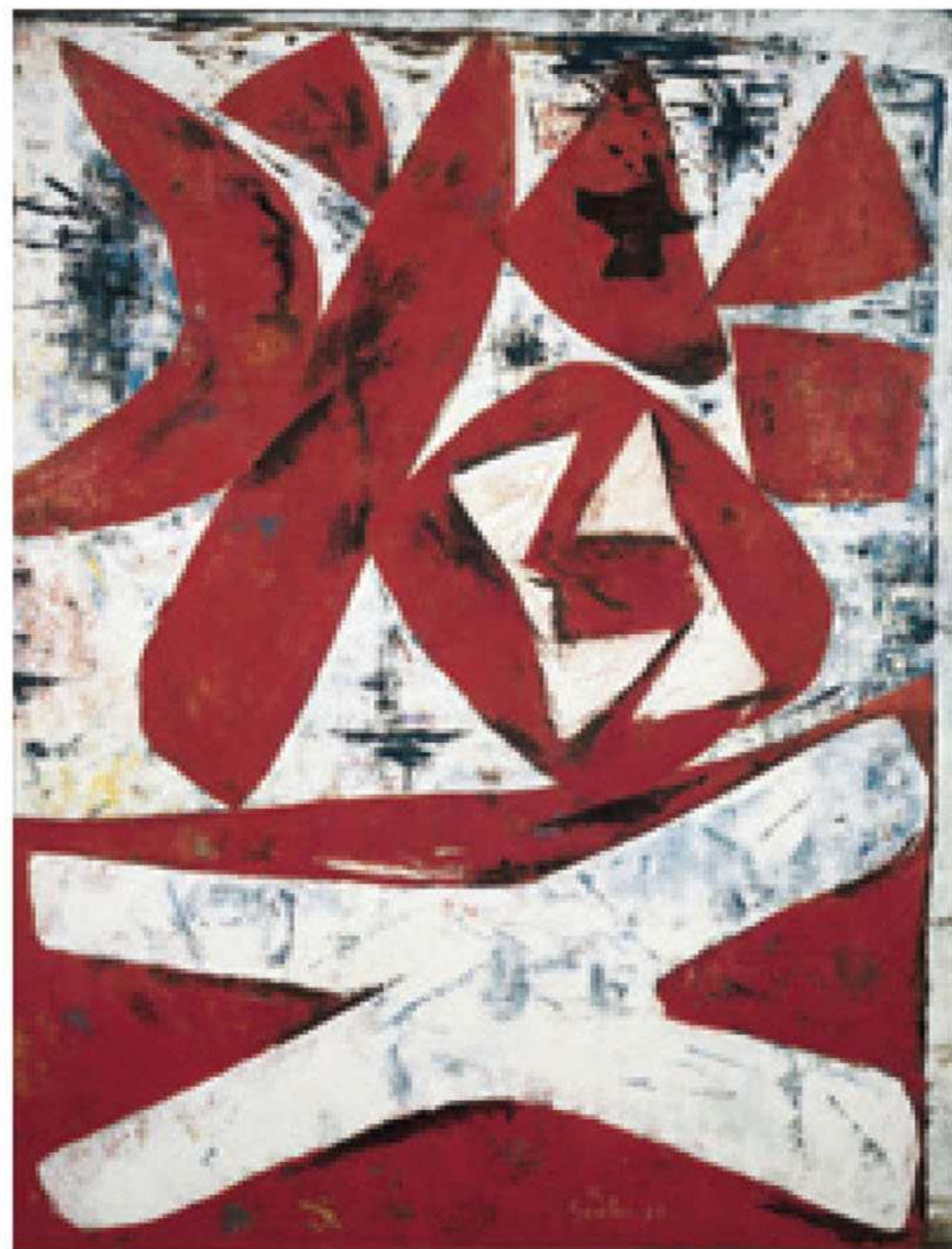
斎藤義重《鬼》1957年、油彩・合板、当館蔵