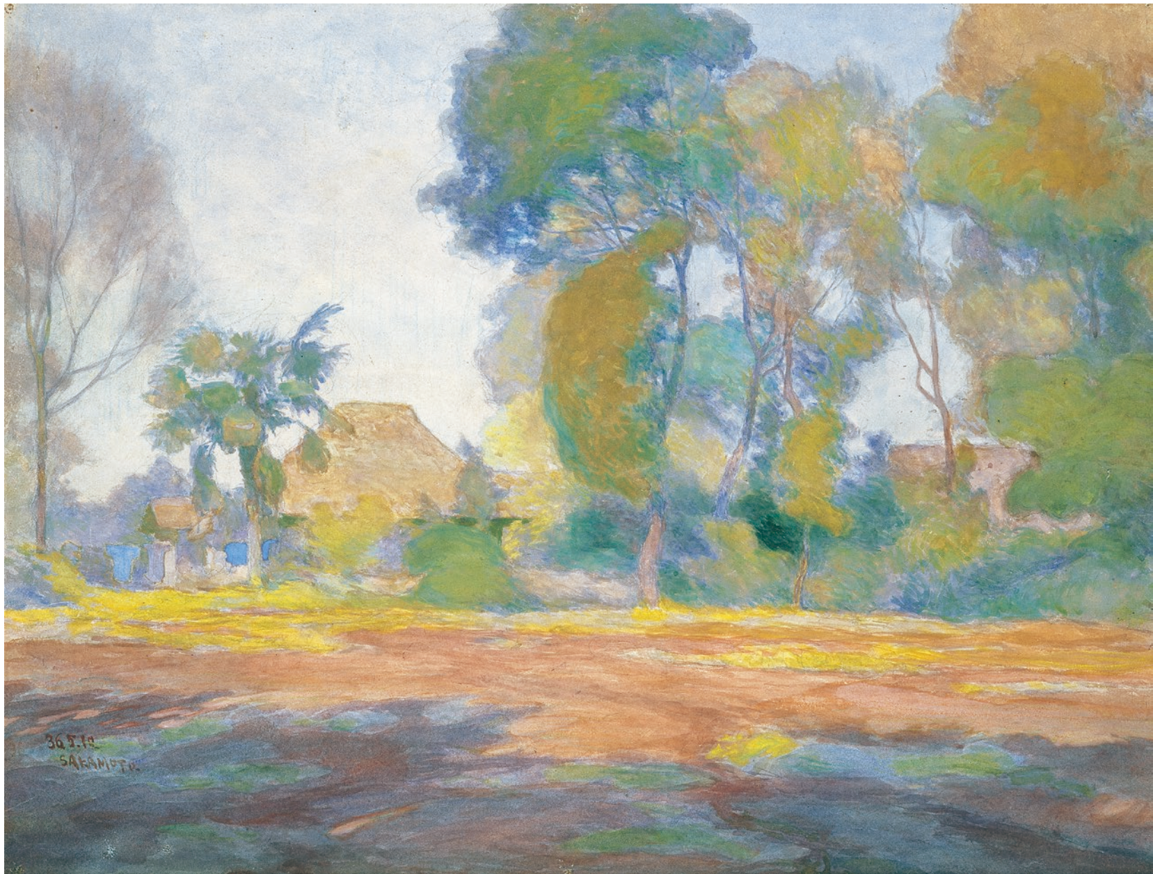
坂本繁二郎《棕呂の見える風景》1903年 水彩、紙 当館蔵