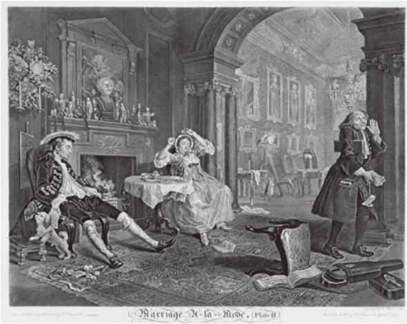
『当世風の結婚』より《第2図 急情な朝》 (初版1745年の後刷り エッチング、エングレーヴィング)