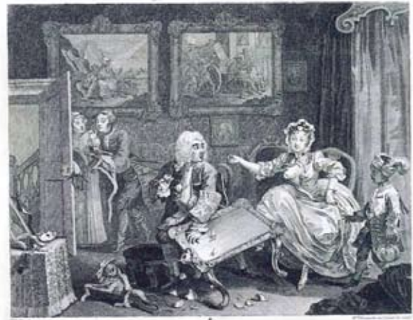
『遊女一代』より《第2図 ユダヤ人のパロント》 (初版1732年の第5版および第6版/1800-10年頃 エッチング、エングレーヴィング)