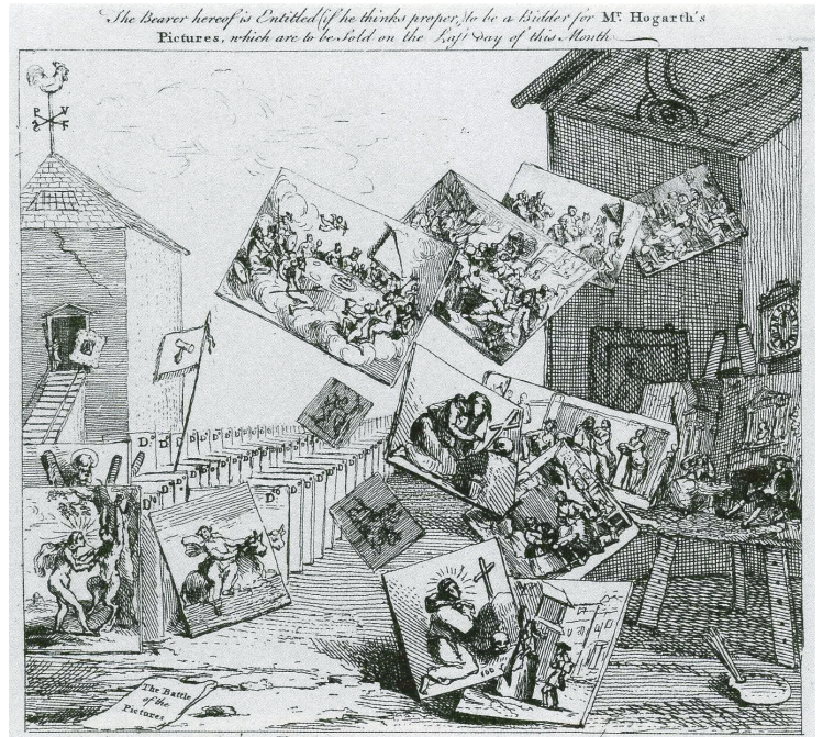
ウィリアム・ホガース《絵画の闘い》1744/45年 エッチング

当館が所蔵する豊かなヨーロッパ版画コレクションのうち、イギリス出身の6人の芸術家による版画約80点を紹介いたします。主な出品作品は、18世紀、中産階級の社会道徳を主題にしたウィリアム・ホガースの連作版画、19世紀初め、ダンテの叙事詩を宇宙的スケールで描いたウィリアム・ブレイクの『神曲』、20世紀ではポップ・アートの先駆的存在といわれるリチャード・ハミルトンの版画集『祖国アイルランド』のほか、ヘンリー・ムーアやケネス・アーミテージといった現代イギリス彫刻界を代表する芸術家たちによる版画などです。時に皮肉を込め、時に温かい目で、人間や風景、そして時代を見つめる芸術家たちは、版画という手法を用いて独自の表現を生み出しています。そこには長い年月をかけて、多様な文化をとり込んで形成されたイギリスという国で育まれた芸術家たちの人生観、宗教観、芸術観が映し出されているのではないのでしょうか。これらの版画をとおして、歴史と伝統の国イギリスから、時代を超え、地域を超え、今のわたしたちに送られた芸術家たちのメッセージを読み取っていただければ幸いです。