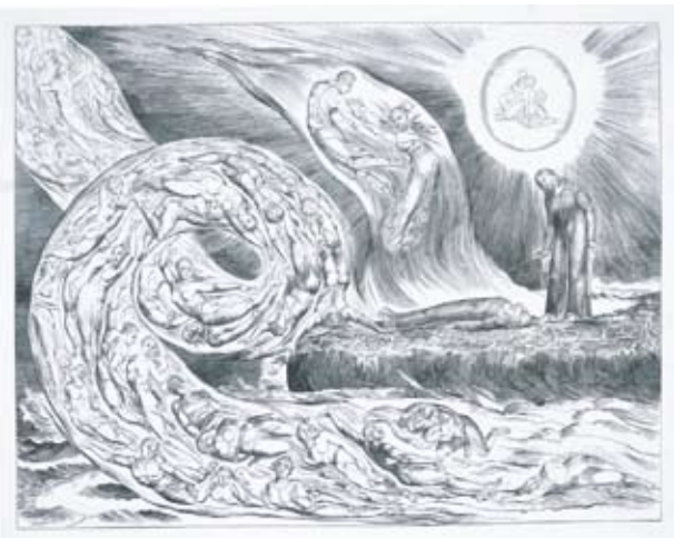
ダンテ『神曲』より《1 愛欲者の圏:フランチェスカ・ダ・リミニ(恋人たちのつむじ風)》 (1827年 エングレーヴィング、ドライポイント)