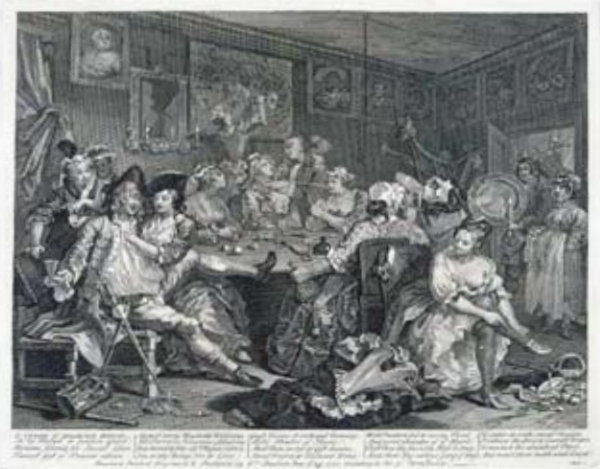
『放蕩一代』より《第3図 居酒屋での散財》 (初版1735年の第3版/1764-65年 エッチング、エングレーヴィング)