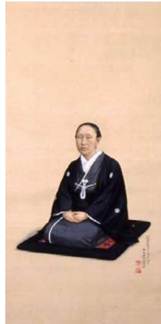
五姓田芳柳《浅野公夫婦の肖像》 1882年 絹本彩色 星野画廊蔵