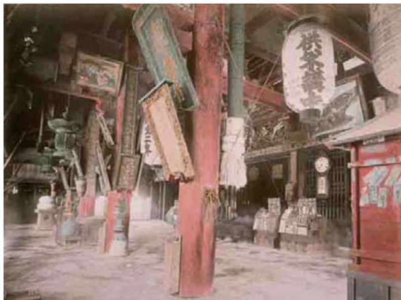
《Inside Asakusa Temple Tokio (浅草寺内部 東京)》 明治時代 鶏卵紙(前期のみ展示)