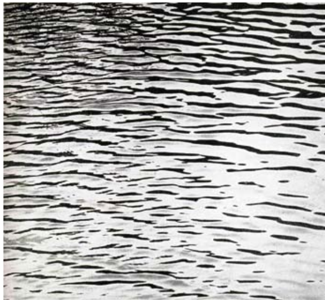
岡本東洋《漣》 1936年 『美術写真大成 秋1』(後期のみ展示)