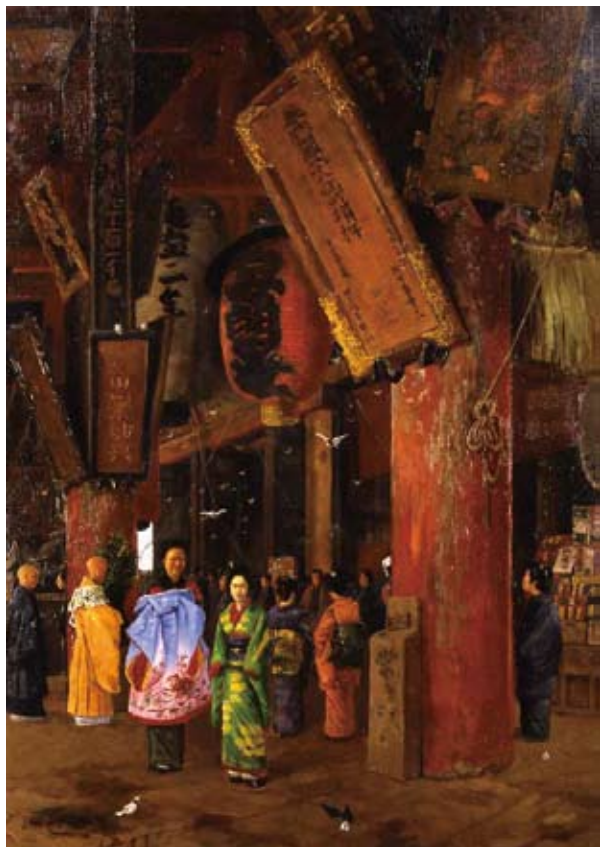
安藤仲太郎《日本の寺の内部》 1893年 油彩、カンヴァス 当館蔵