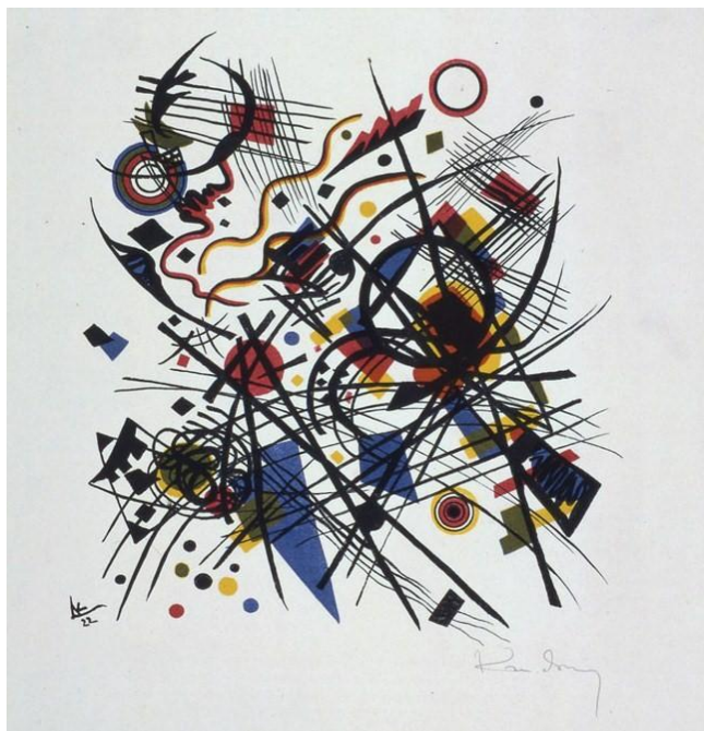
ワシリー・カンディンスキー《構図》1921年、リトグラフ