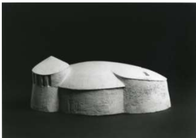
《白い風景VI》2003年 木彫、アクリル絵の具 平塚市美術館寄託