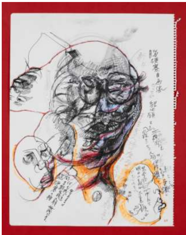
《闘病シリーズ(1)》 2009-10年 インク、鉛筆、色鉛筆、紙

保田春彦(1930年～)は、近年、2003年以後、再び木彫で新境地に挑み、青春時代を過ごした思い出深いイタリアの古民家などを彷彿とさせる、精神性の高い一連の木彫を制作したのち、2007年以後、裸婦クロッキーを日本とフランスで集中的に制作しています。また、去年からの闘病生活のなかでも、治療を受ける自分自身を描く一連の素描をもとに新作に挑んでいます。その数はすでに総数1000点を越えています。それらの作品は、ときに諧謔味を湛えながら、いずれも不屈の意志に貫かれています。クロッキー、素描など80点、彫刻シリーズ《白い風景》のうち7点で構成。それらの作品に漲り溢れる若々しい創造精神のエネルギーは、多くのひとに深い共感と感動をあたえることと思います。