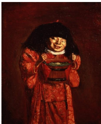
岸田劉生《野童女》1922年(寄託)