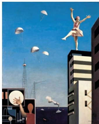
古賀春江《窓外の化粧》1930年

プレスリリース、及び展覧会情報は美術館ホームページでもご覧いただけます。 http://www.moma.pref.kanagawa.jp