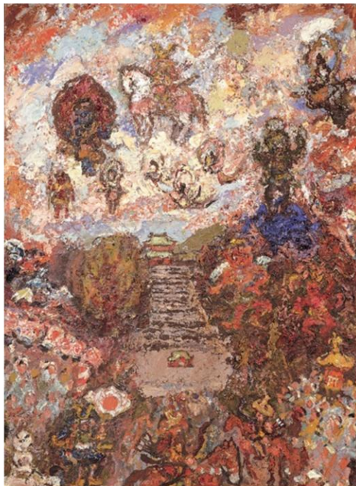
朝井閑右衛門 《祭 III-鶴ヶ岡》1977年