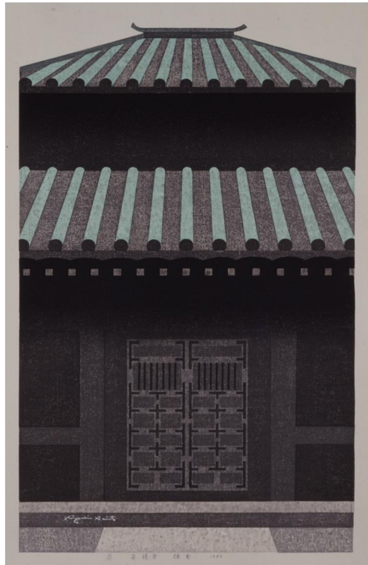
斎藤清 《扉(英勝寺鎌倉)》1984年

The Museum of Modern Art, Kamakura opened in 1951 as the first public modern museum in Japan. It has been deeply involved with and supported by the locality of Kamakura and the plentiful culturati living there. This exhibition features artists and works affiliated to Kamakura from our own museum collection. There are also works by artists such as Georges Roualt, UEMURA Shoko, and SUNAZAWA Bikky, which entered our collection in the fiscal year of 2011. FUJITA Tsuguharu's Kiki de Montparnasse, which has been added as The Kitagawa Collection, is being shown for the first time.