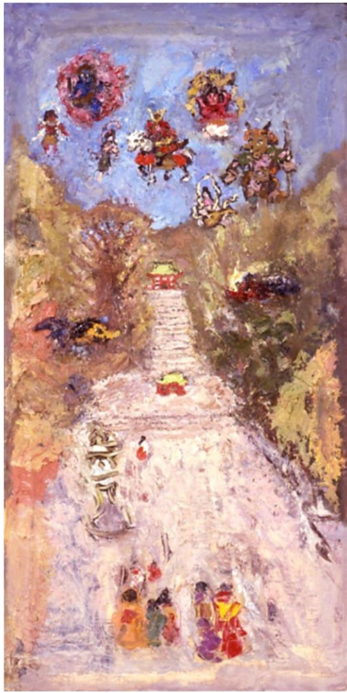
朝井閑右衛門 《祭 II-巫女さん》1977年