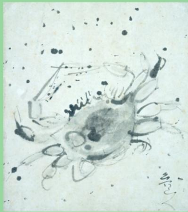
北大路魯山人《蟹》1944年頃 (木下翔逅コレクション)