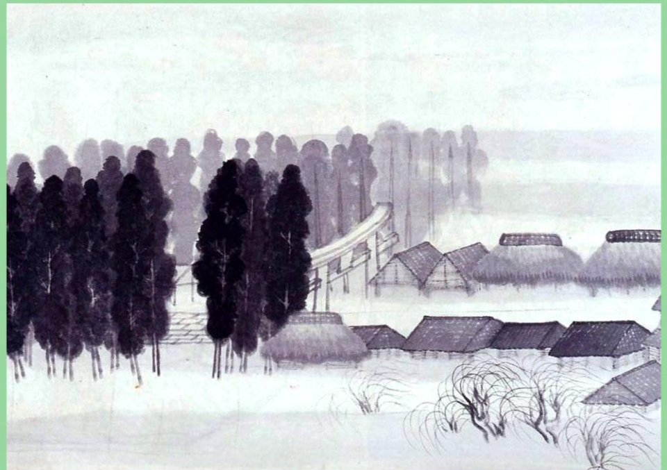
牛田雞村《鎌倉の一日》(部分) 制作年不詳

■お問合せ先: 神奈川県立近代美術館 鎌倉 〒248-0005 鎌倉市雪ノ下2-1-53 Tel.0467-22-5000 Fax.0467-23-2464 広報担当: 松尾、酒井 展覧会担当: 橋