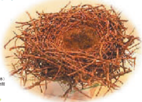
ハンプ・ガラスの巣 (小海運部次郎氏所蔵標本)