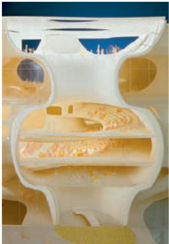
《台中X10ボタシ・オペラハウス》模型