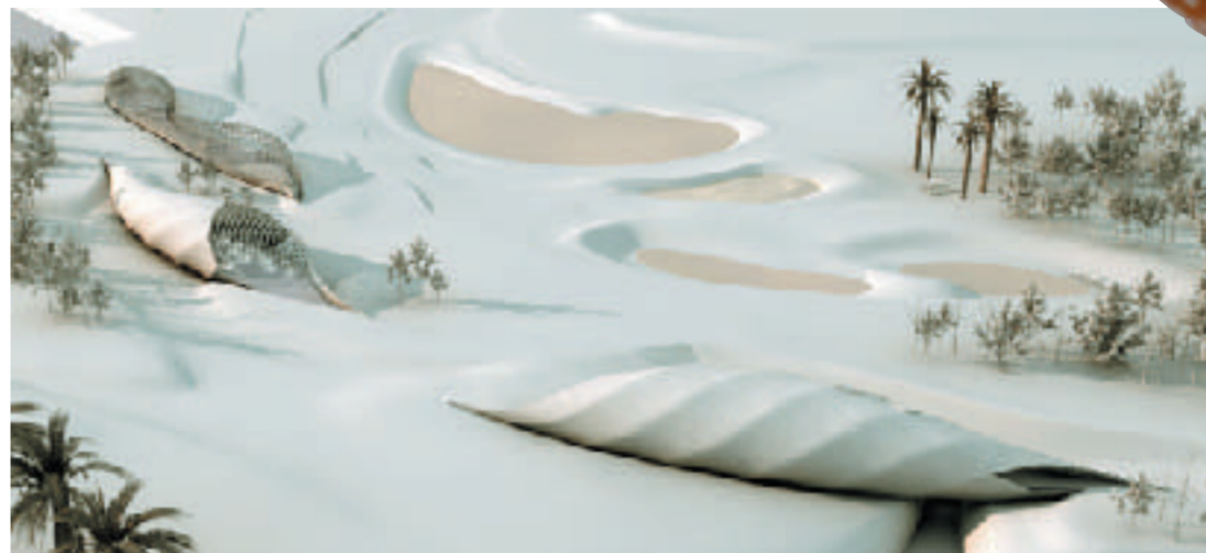
《リラクゼーションパーク・イン・トレヴィエラ》構想案