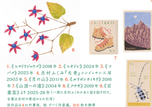
1.《ヒドリジョウゴ》2018年 2.《ヒオドシ》2024年 3.《ツバメ》2025年 4.志村ふくみ『天青』シンジュン工房 2003年 5.《月の山》2011年 6.《ルリボシカミキリ》2016年 7.《山頂への道》2004年 8.《クサギ》2019年 9.《百葉筥》より 2025-26年 (一部に志村ふくみの茶と製を貼り付け。言葉は志村の著述からの引用) ※作品は4以外薯版、紙すべて作家蔵。