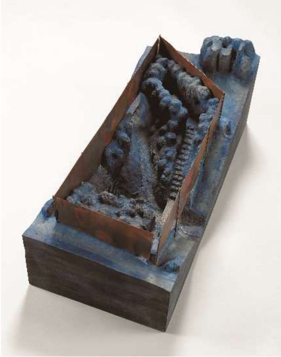
若林畜《緑の森の一角獣座 模型》1996-97年 鉄、銅、木(檜)、インク、グアッシュ 神奈川県立近代美術館寄託

From Museum Collection: A Brief History of Open Air Sculpture in The Museum of Modern Art, Kamakura & Hayama 2019年4月6日(土) - 6月23日(日)