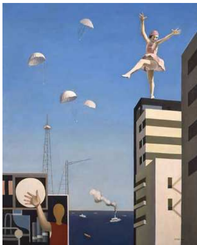
古賀春江《窓外の化粧》1930年 油彩、カンヴァス 神奈川県立近代美術館蔵

2016年3月に閉館した旧鎌倉館の伝統を、形ではなく精神として受け継ぎ、神奈川県立近代美術館の鎌倉における新たな拠点として、鎌倉別館はリニューアル・オープンします。