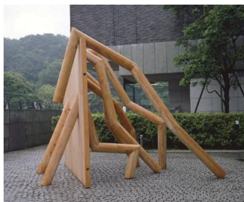
最上壽之《トントンビョウシノアシビョウシ》1989年