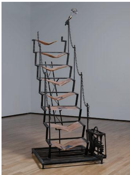
村岡三郎《タラップ(いろはにほ...)》1967年