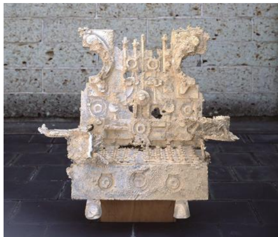
向井良吉《勝利者の椅子》1964年