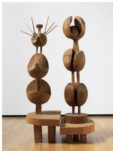
砂澤ビッキ《北の王と王妃》1987年