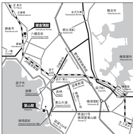
●鎌倉別館は空調設備移設工事のため休館中です。

※貸切バス等(定員11名以上)でご来館の場合、駐車場の事前予約および前面道路の通行許可申請が15日前までに必要です。団体名、連絡先、来館日時、台数をご連絡ください。Tel: 046-875-2800