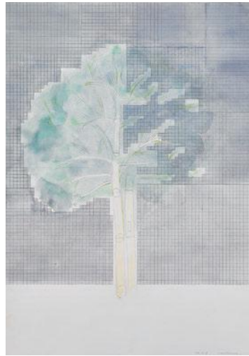
《桐の木 | 2002.5.29》2002年 鉛筆、色鉛筆、水彩絵具、紙