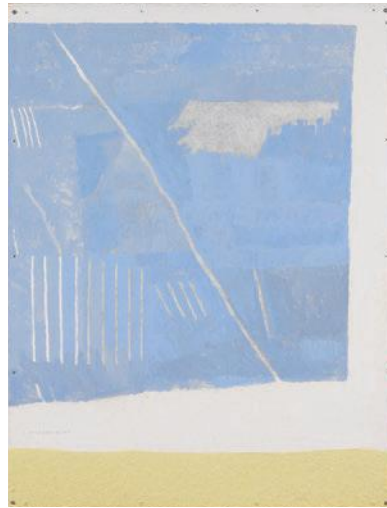
《Sulphur Drawing No.5》1990年 硫黄、グアッシュ、木炭、紙