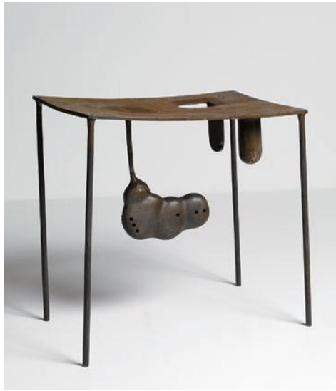
《中に犬 IV》1968年 鉄