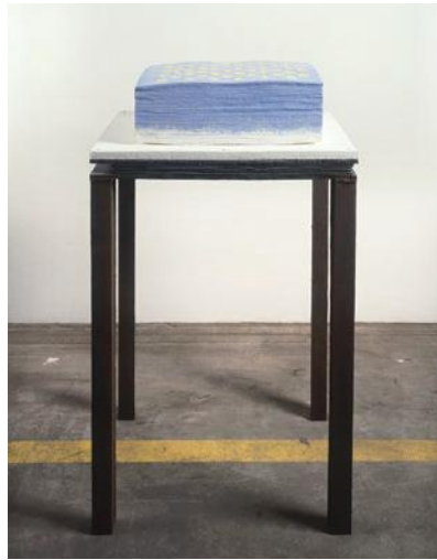
《Work No.2, 1990》1990年 鉄、紙、硫黄、グアッシュ