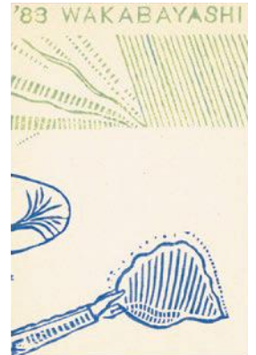
《1983年 年賀状》1982年 版画、紙