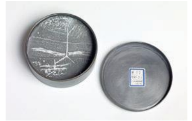
《100線 No.57》1985年 鉄、鉛、グアッシュ