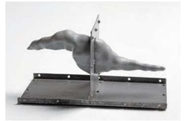
《燃える飛行機の煙の軌跡 (10×10 VII)》1968/1995年 ステンレススチール、木、ラッカー