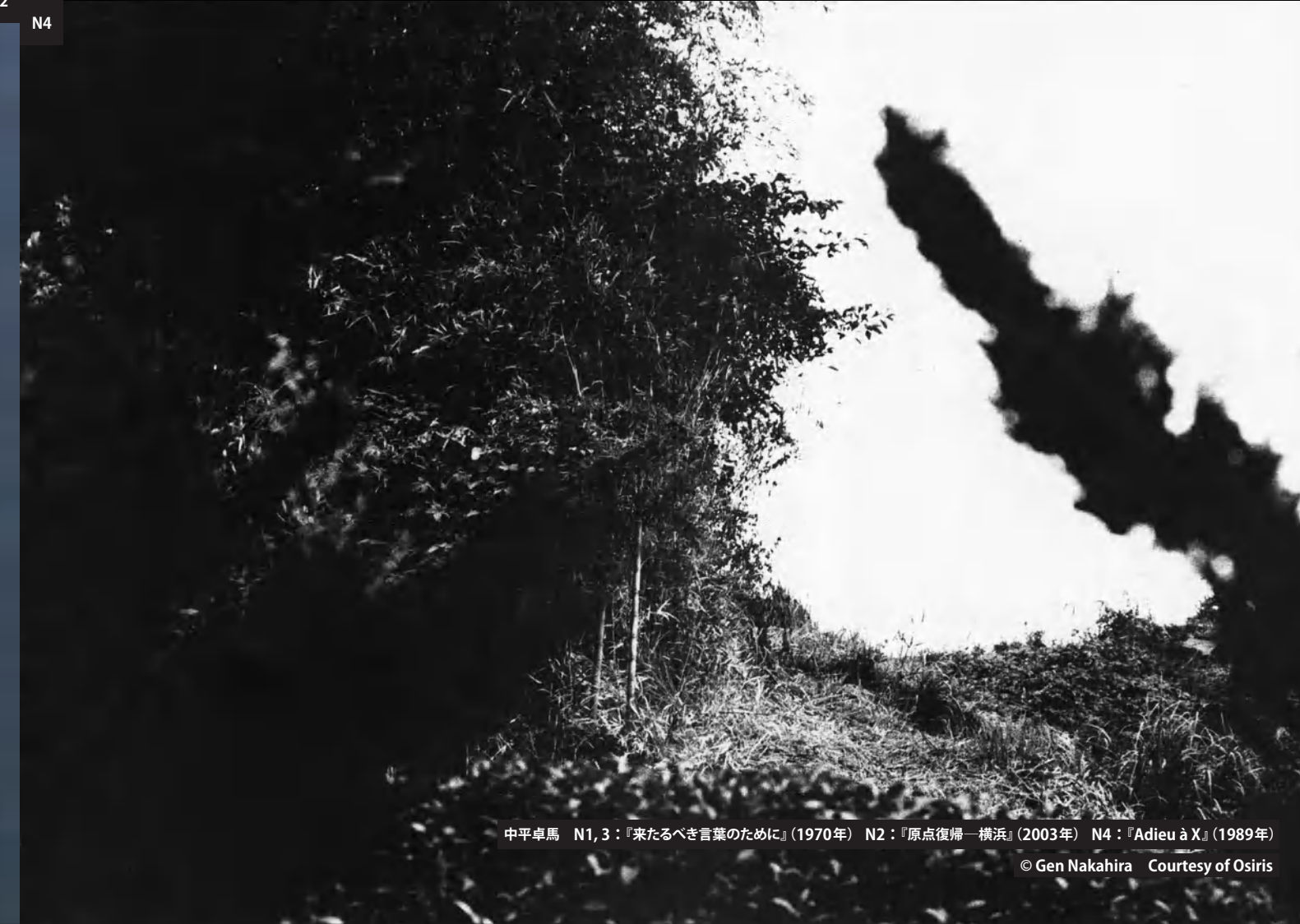
中平卓馬 N1, 3: 『来たるべき言葉のために』(1970年) N2: 『原点復帰一横浜』(2003年) N4: 『Adieu à X.』(1989年)