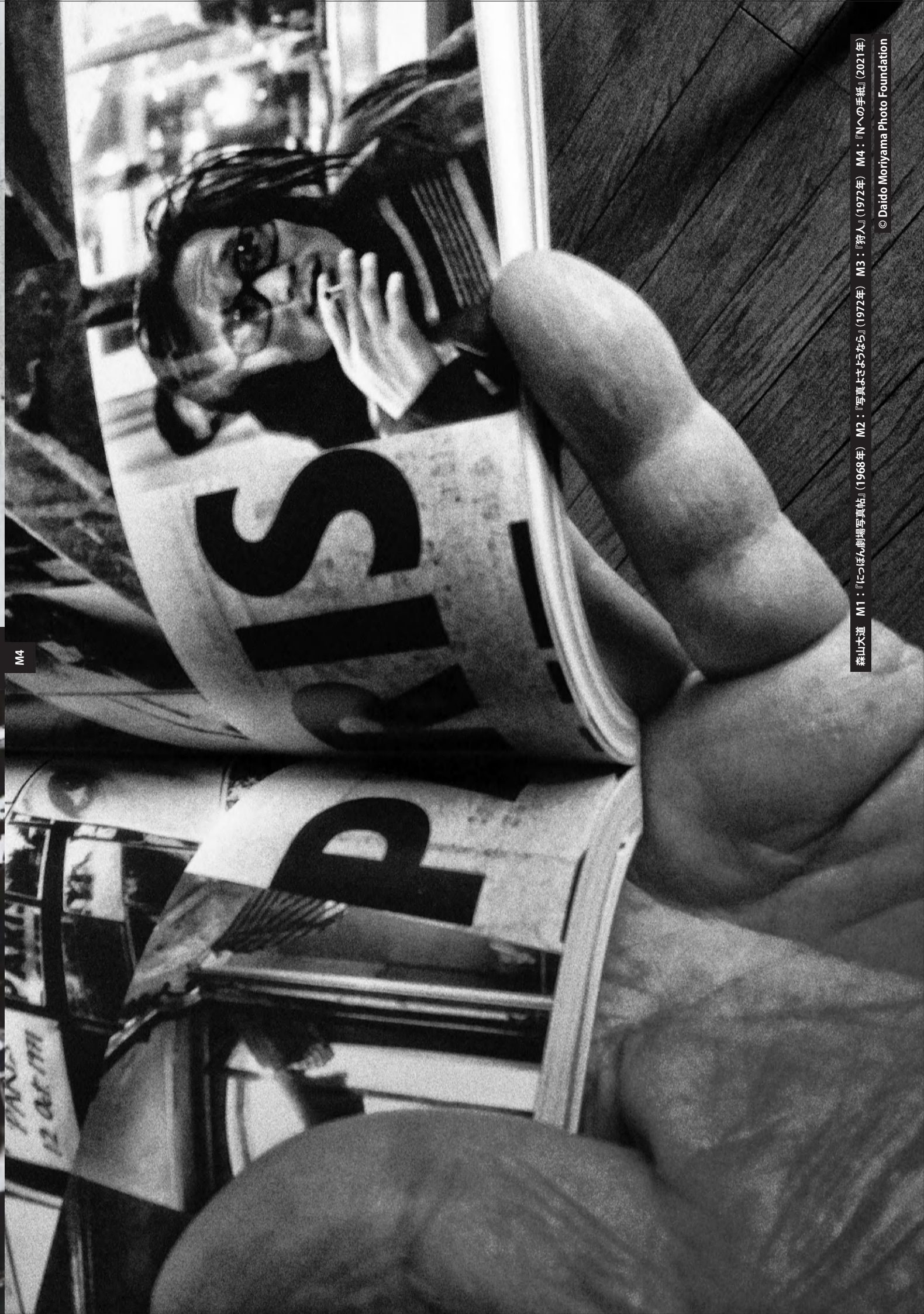
森山次理 M1: 『北へ帰る』(1968年) M2: 『雪裏まよひよつら』(1972年) M3: 『野人』(1972年) M4: 『Nへの手紙』(2021年)