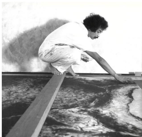
〈触〉制作風景 1989年（撮影：馬場直樹） ©The Estate of Katsuro Yoshida / Courtesy of Yumiko Chiba Associates

多摩美術大学で斎藤義重に学んだ吉田克朗（1943－1999）は、1969年から物体を組み合わせ、その特性が自然に表出されるような作品を制作し始めます。このような作風を示す動向は後に「もの派」と称され、国際的に注目を浴びることになりますが、吉田はその先鞭をつけた作家のひとりでした。やがて「もの派」の作風から離れた吉田は、1970年代から転写などの実験的な手法を試みながら絵画表現を模索しました。1980年代前半には、風景や人体を抽象化して描く〈かげろう〉シリーズ、1980年代後半からは、粉末黒鉛を手指でこすりつけて有機的な形象を描く〈触〉シリーズを発表し注目を集めますが、惜しくも55歳で逝去しました。本展は、吉田克朗の全貌に迫る初めての回顧展となります。これまでほとんど紹介されてこなかった作品や、作品プランやコンセプトを綴った制作ノートなどの資料を、調査をもとに展示します。転換期を迎えていた同時代の美術動向に向き合いながら、自ら選択すべき道について真摯に問い続けた吉田克朗の制作の軌跡を辿ります。