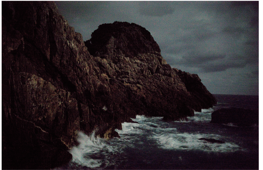
上段左から《at Home / Morie and Karen / Hayama》1996年、《Apple Tree No.2 / Gunma》2017年、《Quinault No.39 / Washington》1990年、下段左から《M.Ganges No.2 / Varanasi》2014年、《Mater No.1 / Yakushima》2021年