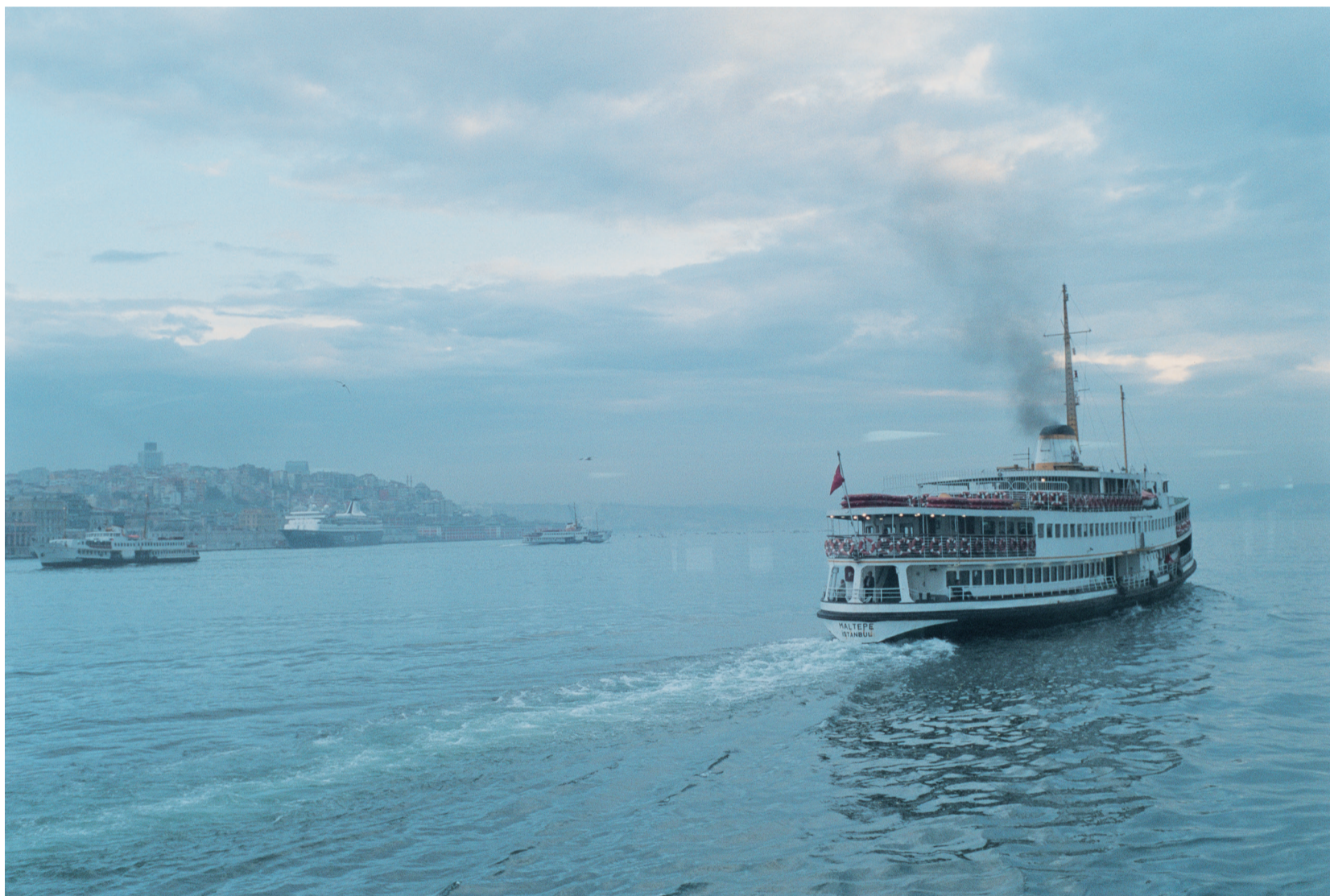
Muji / Istanbul 2008 年

2025.7.19 (土) – 11.3 (月・祝) 神奈川県立近代美術館 葉山 Sat. July 19 – Mon. Nov. 3, 2025 The Museum of Modern Art, Hayama