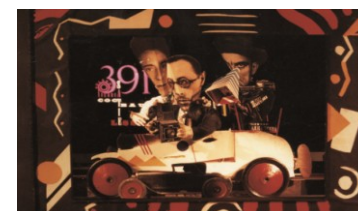
『イーゴリー——パリでプレイエルが仕事を提供していた頃』1982年