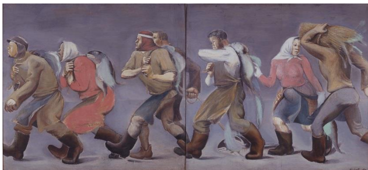
2. 阿部合成 《鱈をかつぐ人》1937年頃 油彩、パネル 当館蔵