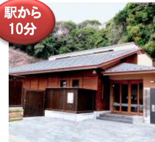
鎌倉市川喜多映画記念館