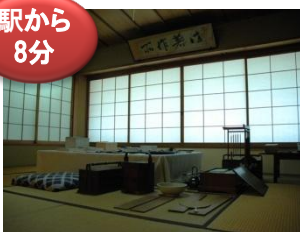
鎌倉市鎌木清方記念美術館