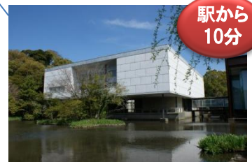
神奈川県立近代美術館 鎌倉