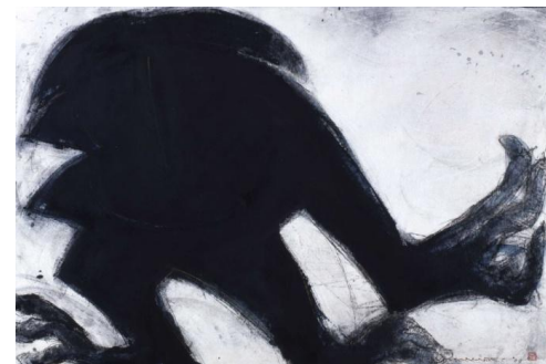
《鬼》2009年 墨、松煙、木炭、パステル、紙

6月19日(土) 午後3時～5時 *申込みが必要です 詳しくはホームページをご覧ください