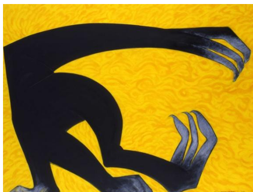
《あふれ来るもの》2010年 油彩、アクリル、松煙、木炭、カンヴァス