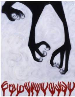
《救うか》2010年 油彩、アクリル、 松煙、木炭、カンヴァス