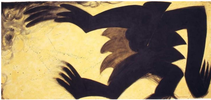
《鬼 I》2009年 アクリル、松煙、木炭、カンヴァス