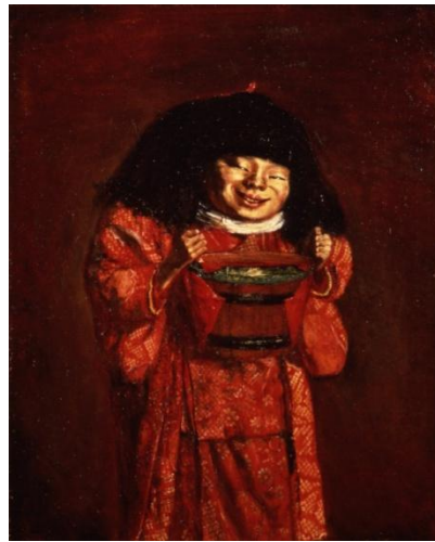
岸田劉生《野童女》1922 年(寄託)