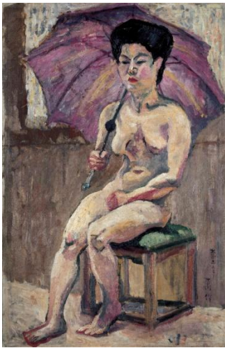
萬鉄五郎《日傘の裸婦》1913 年

神奈川県立近代美術館は、開館 60 周年を記念して「近代の洋画 ザ・ベスト・コレクション」を開催いたします。1951 年 11 月の開館時に所蔵品のない美術館としてスタートした神奈川県立近代美術館は、60 年の時を経て、10,000 点あまりの所蔵作品を数えるまでになりました。ジャンルでいえば、その所蔵品は、油彩画だけではなく、日本画、彫刻、水彩・素描、さらには版画に至るまで多岐にわたっています。そうした中で、開館当初から現在に至るまで一貫して所蔵に努め、展覧会を通して研究に励んでいるのが、日本近代の洋画の分野です。この展覧会では、多くの方々に日本近代洋画の豊饒なる世界を味わっていただけるよう、近代洋画の父ともいべき高橋由一の油彩画が描かれる明治から大正を経て、神奈川県立近代美術館が開館する昭和 26 年までの近代洋画の歴史を、当館の代表的な所蔵作品約 100 点を通して通観いたします。80 年に及ぶ日本近代洋画のダイナミックな流れをぜひご堪能下さい。なお展示は前期と後期に分けられ、各期にて特集展示を行います。