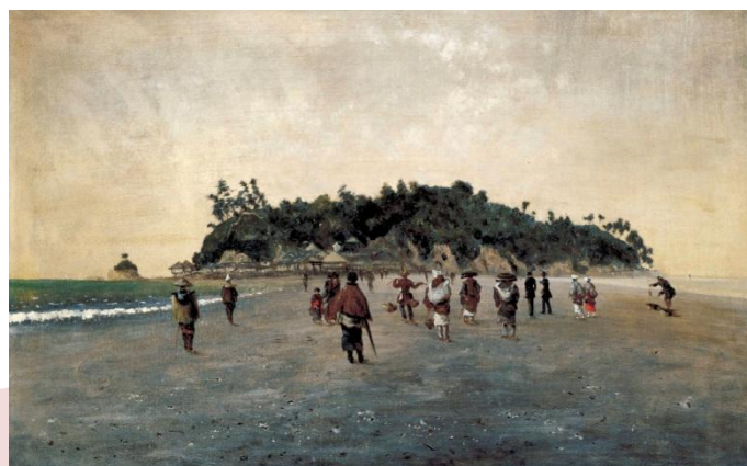
高橋由一《江の島図》1876-77年