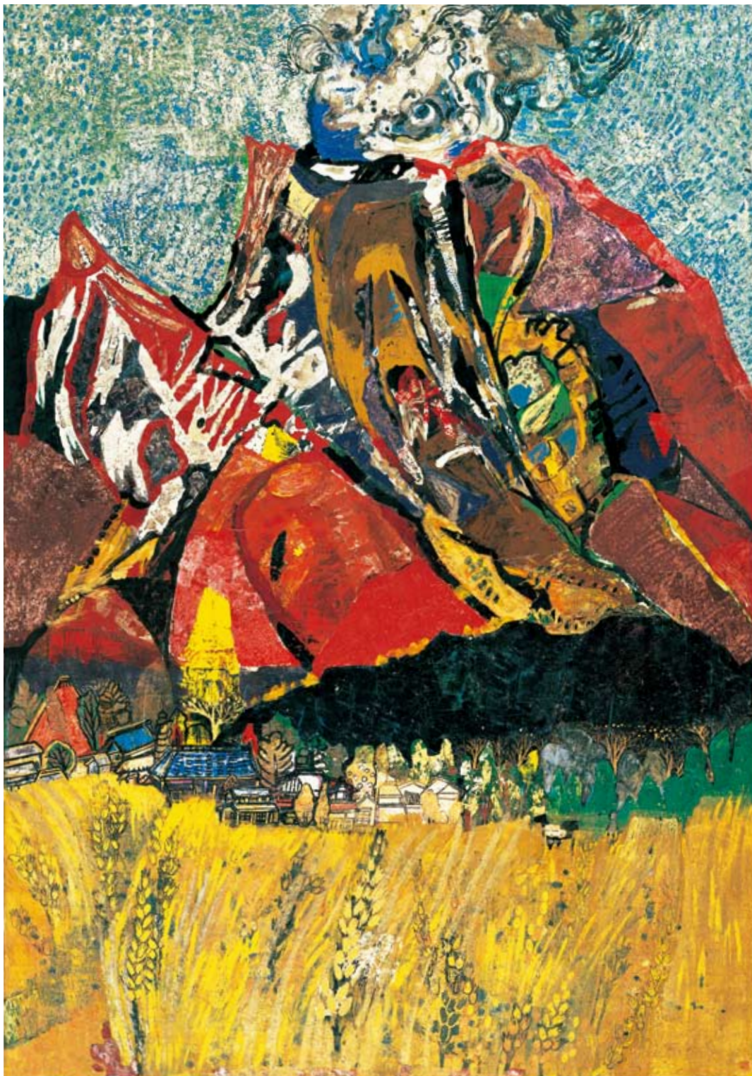
《火山(浅間山)》1965年 紙本着彩 額装 神奈川県立近代美術館蔵