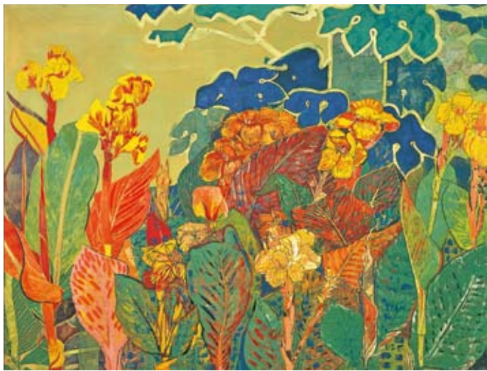
《カンナ》1953年 紙本着彩 額装 神奈川県立近代美術館蔵