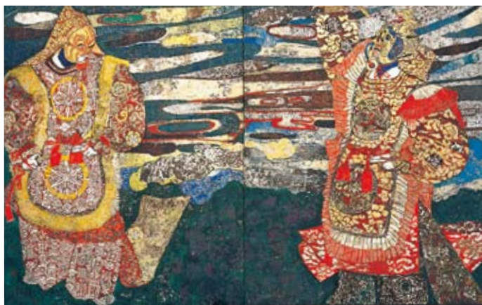
《幻想》1961年 紙本着彩 額装二面 神奈川県立近代美術館蔵