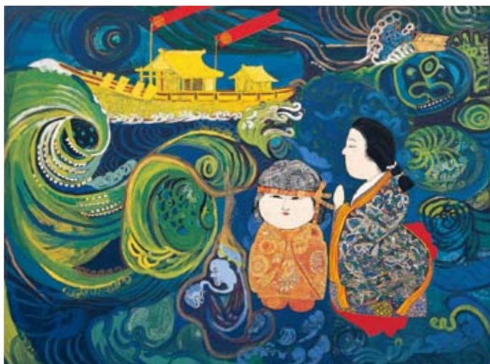
《海(鳴門)》1962年 紙本着彩 額装 神奈川県立近代美術館蔵