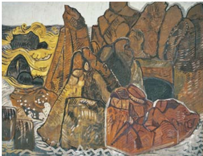
《海(真鱈の海)》1961年 麻布着彩 額装 神奈川県立近代美術館蔵