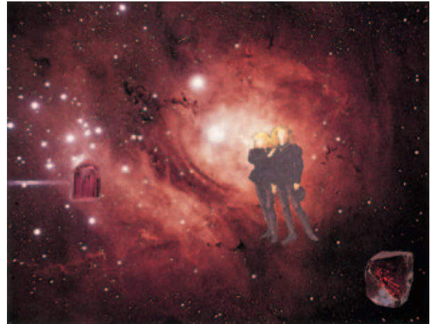
《ジョバンニとカンパネラ9》 1996-2002年 コラージュ 当館蔵