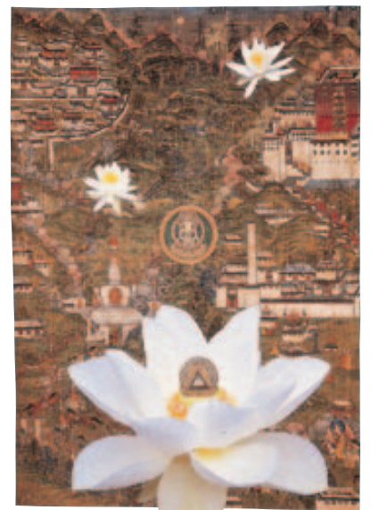
《連作「蓮華集」その9 大日如来を囲むラサの寺院と僧院》 1999年 コラージュ 当館蔵