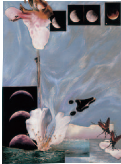
《夢の地表 I 愛の歌》 1978年 コラージュ、パステル 当館蔵