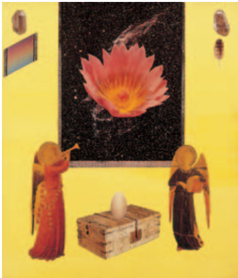
《天使について-フラ・アンジェリコ(画のある)》 1990年 コラージュ 当館蔵