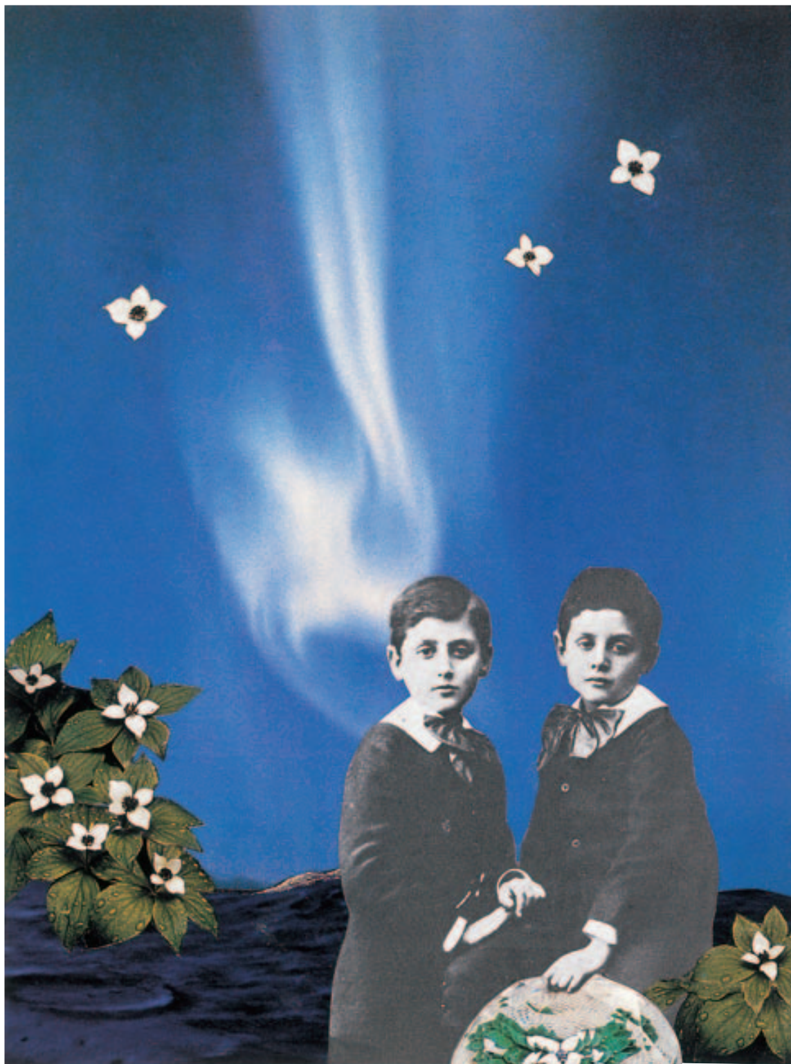
マルセル・ブルーストヤ集 - 1906年 写真: ニューマン 監修