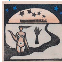
谷中安規《旅》(『方寸版画 幻想集』8) 1933年 木版

同時開催の堀文子展にあわせ、旅と季節をキーワードに、自然がおりなす生の息吹きと、その風景に囲まれ、ときにこれを旅する美術家たちのまなざしを伝える所蔵作品を紹介します。日本画・洋画・版画・彫刻から現代美術まで、冬から春に向かう葉山の静謐な空気とともに、展示室での小旅行をお楽しみください。