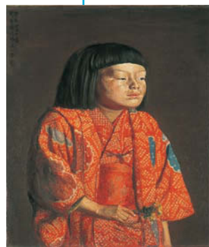
岸田劉生《童女図(麗子立像)》 1923年 油彩

明治の流れを継承しながら、自由な表現を求めて若者たちが革新的な芸術を花開かせた大正時代。1912(大正元)年に岸田劉生や萬鐵五郎がヒュウザン会を起し、1914年創設の二科会では関根正二や村山槐多が活躍。1920年代には村山知義らが前衛をリードするなど、その時代性と熱い鼓動を通覧します。併陳で新収蔵作品も紹介。