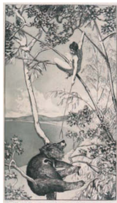
マックス・クリンガー 《<まど妖精》(『間奏曲、 作品IV』1) 1881年 エッチング、アクアティント 当館蔵

19世紀から20世紀の転換期にドイツで活躍した彫刻家・画家・版画家のマックス・クリンガー(1857-1920)。細密な写実性と幻想性をあわせ持ち、シュルレアリスムの先駆けともされる版画連作を生涯で14組制作し、音楽に用いる作品番号(Opus)を付けています。『イヴと未来、作品III』『間奏曲、作品IV』『手袋、作品VI』『ある愛、作品X』を所蔵する当館で、その生誕160年を記念する版画展を開催します。