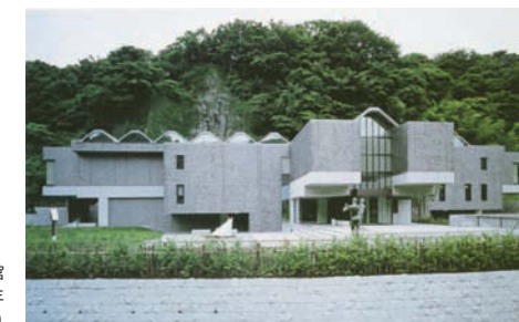
竣工時の鎌倉別館 1984年