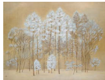
堀文子《霧水》1982年 紙本着彩 当館蔵

※会期中、一部展示替を行います。 前期11/18~1/21 後期1/23~3/25