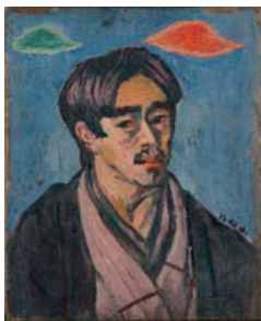
萬鐵五郎 《雲のある自画像》 1912年 油彩 大原美術館蔵